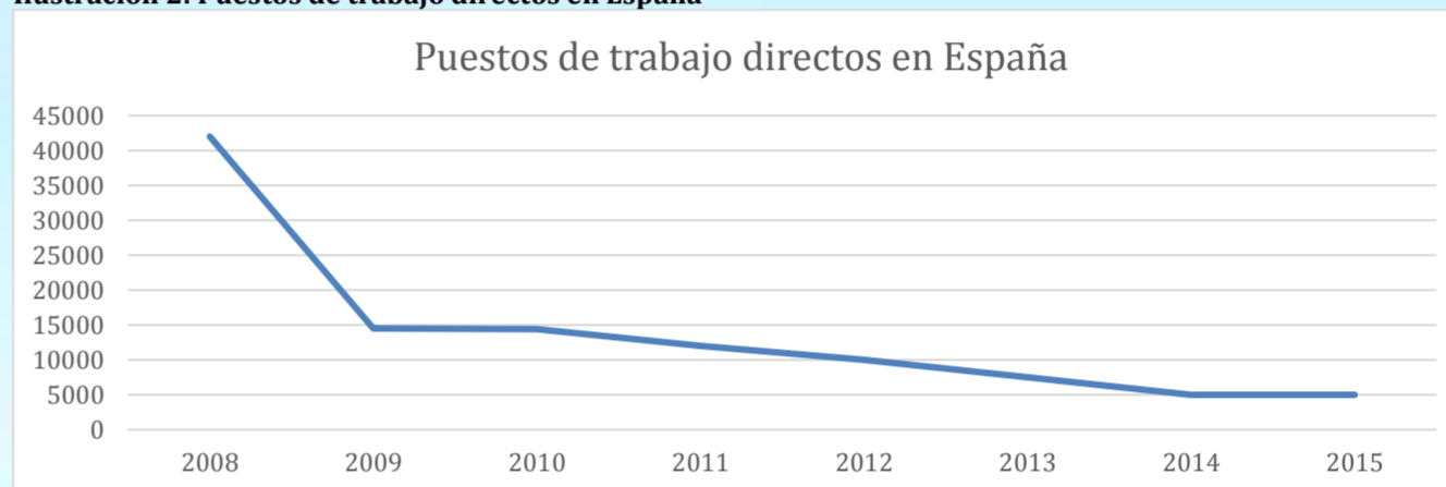
Ilustración 2: Puestos de trabajo directos en España